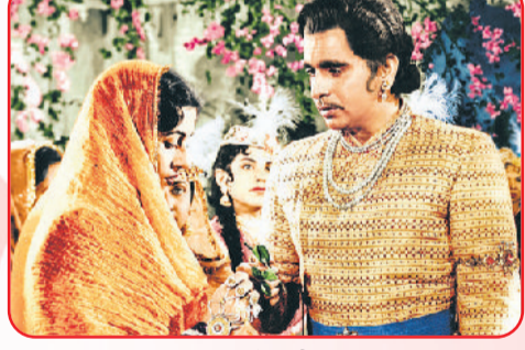
'मुगल-ए-आजम' में दिलीप कुमार-मधुबाला

में बनी फिल्म सम्राट 'चंद्रगुप्त' में भी भारत भूषण और निरूपा राय की जोड़ी थी। सन 1946 में पृथ्वीराज कपूर और मीना कुमारी अभिनीत फिल्म 'पृथ्वीराज संयोगिता' बनी थी। जो इनके प्रेम पर आधारित थी। वर्ष 2022 में यशराज फिल्मस ने अक्षय कुमार-मानुषी छिल्लर अभिनीत फिल्म 'सम्राट पृथ्वीराज' का निर्माण किया था। रजिया सुल्तान और याकूत की प्रेम