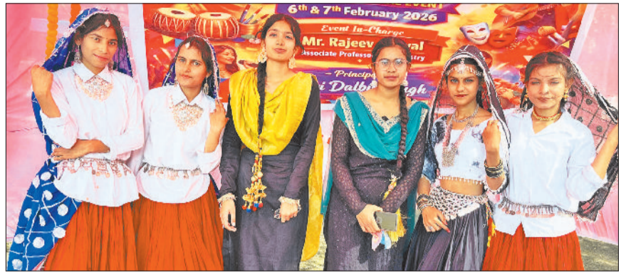
बहादुरगढ़। कार्यक्रम के दौरान सांस्कृतिक प्रस्तुति देती छात्राएं।