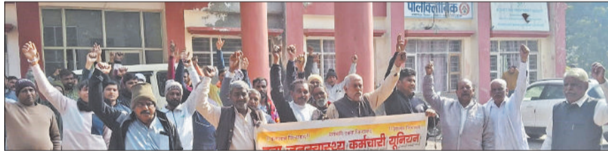
बहादुरगढ़। मांगों को लेकर नारेबाजी करते कर्मचारी।