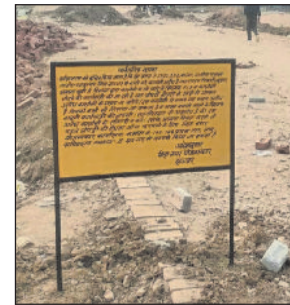
बहादुरगढ़। अवैध कॉलोनिनों में डीटीपी द्वारा लगाया नोटिस बोर्ड।