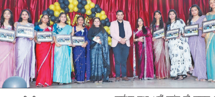
हरिभूमि न्यूज ►► बहादुरगढ़

मॉडर्न स्कूल में सीनियर विद्यार्थियों के सम्मान में विदाई समारोह का आयोजन उत्साह और हार्मोनियस के साथ किया गया। कार्यक्रम में कक्षा 11वीं और 12वीं के विद्यार्थियों ने सक्रिय रूप से भाग लिया। शनिवार को हुए कार्यक्रम में छात्राओं ने सांस्कृतिक गतिविधियां प्रस्तुत कीं। नृत्य, गीत, भाषण व मनोरंजक प्रस्तुतियां देकर उपस्थितजनों का मन मोह लिया। मंच का