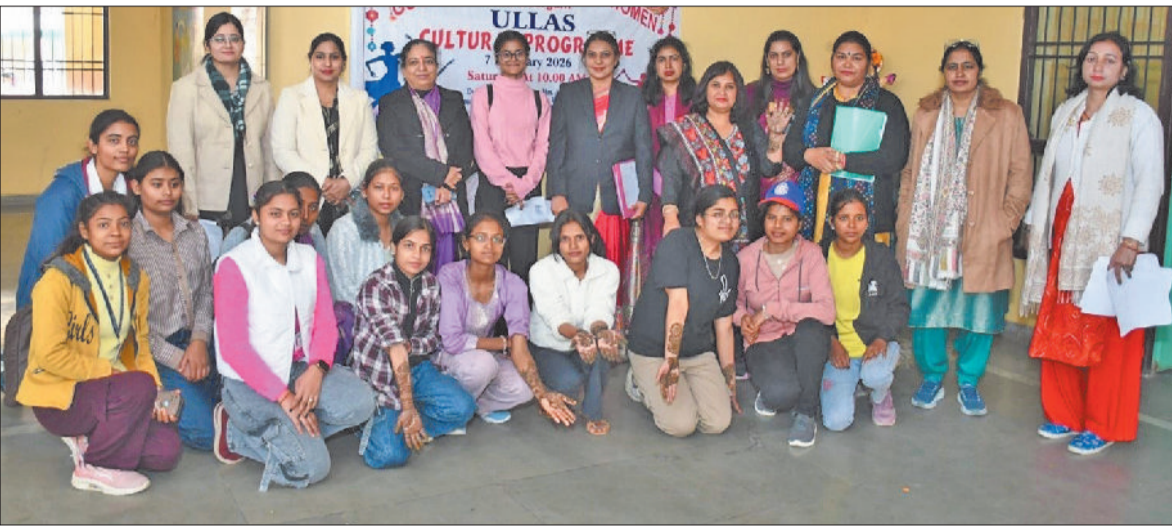
हरिभूमि न्यूज ►► बहादुरगढ़