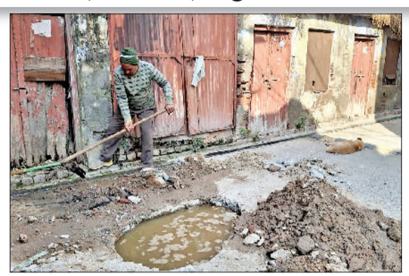
झज्जर। भट्टी गेट क्षेत्र में गड्डे में भरा और बेरी गेट क्षेत्र में सड़क पर फैला सीवरेज का गंद पानी।