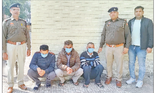
झज्जर। पकड़े गए आरोपी पुलिस टीम के साथ।