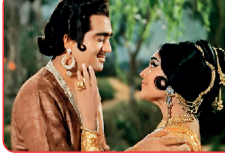
'आम्रपाली' में सुनील दत्त के साथ वैजयंती माला